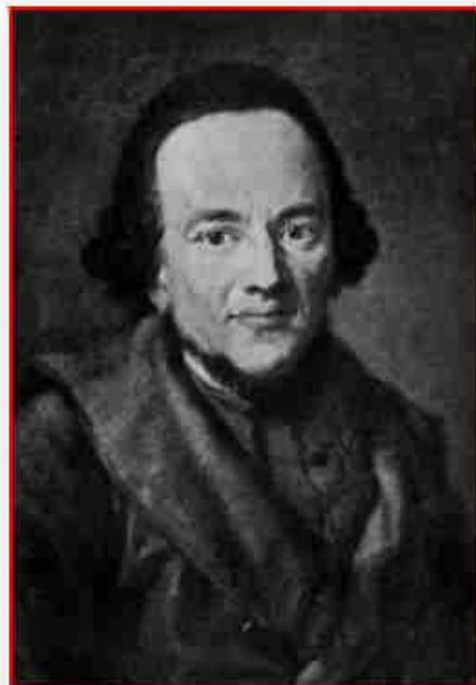
'Mosses Mendelsshon' by Magnus Manske

Ο Mosses Mendelsshon (1729-1786) στο «Phädon oder über die Unsterblichkeit der Seele» (1767) –έργο σε ένα γλωσσικό ύφος εναργέστατο και καλογραμμένο-, ρίχνει μια διεισδυτική ματιά στα «σκοτεινά» εκείνα σημεία των ενοτήτων από το 70c έως 105e και δίδει απαντήσεις σε πολλά ζητήματα που προέκυψαν στους κύκλους της γερμανικής διανοήσεως του 18 ου αιώνας. Ο μεγάλος αυτός στοχαστής, κοιτάζει με μια περιφρονητική ματιά το σωκρατικό δαιμόνιο θεωρώντας το ως «υπόλειμμα δεισιδαιμονίας» και ακυρώνει κάθε έννοια μεταφυσικής υποστάσεως της ψυχής · εγκύπτει στην ανθρώπινη πλευρά του Σωκράτους και διερευνά μέσα από το πρίσμα της ηθικής αξιολογίας, την «στάση» του φιλοσόφου