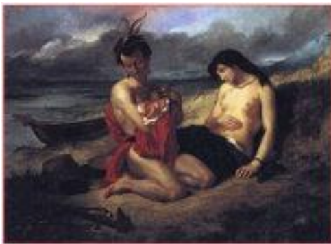
Eugene Delacroix, "The Natchez"

Ύστερ' από τις εκθέσεις του 1817 και 1819, επακολούθησαν αυτές των ετών 1822 και 1824, στις οποίες «ρομαντικοί» καλλιτέχνες όπως οι E. Delacroix και Gericault , άρχισαν να καθιερώνονται στο καλλιτεχνικό στερέωμα. Στην πρώτη έκθεση του 1817, ο Delacroix, παρουσίασε την «Λέμβο» του Dante, ενώ στη δεύτερη τις «Σφαγές της Χίου». Στην έκθεση όμως του 1827 3 , σημειώνεται η οριστική ήττα των «νεοκλασικών», γεγονός που θα σημάνει και την οριστική καθιέρωση του E. Delacroix (1798-1863) ως ηγέτη του γαλλικού ρομαντισμού στον χώρο των εικαστικών τεχνών.